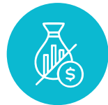
No Financiero (APNFD)

Cada participante podrá elegir uno (1) de estos perfiles