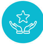
Mercado de Valores